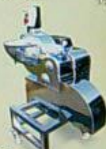
EC-309 切丁機 用途：切丁、切片、切絲、切片、切丁 雙層馬力 馬力 尺寸(mm) 重量 HP 550x440x1050 800kg/3p