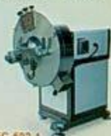
EC-502-1 專用切菜機 用途：切菜、切片 馬力 尺寸(mm) 重量 170Pw 630x440x710 50kg