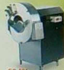
EC-501 薯絲、片機 用途：小薯、紅薯、切絲、切片 1.5-2.0mm 厚 馬力 尺寸(mm) 重量 170Pw 510x450x650 45kg