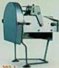
EC-302-1 切菜機(皮帶式) 用途：切菜、切片、切絲、切片 馬力 尺寸(mm) 重量 110Pw 380x350x130 20kg DC