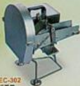
EC-302 切菜機 用途：切菜、切片、切絲、切片 馬力 尺寸(mm) 重量 110Pw 430x190x120 16kg DC