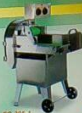
EC-305-1 雙層切菜機 用途：切菜、切絲、切片、切丁 高壓刀 馬力 尺寸(mm) 重量 DC 700x440x1200 70kg 110Pw