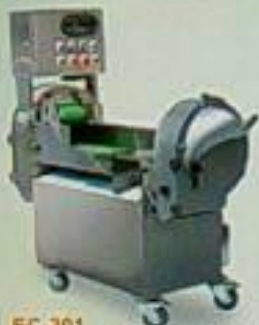
EC-301 球根切菜機 用途：切球、切絲、切丁、切片、切絲、切片、切丁 馬力 尺寸(mm) 重量 110Pw 1200x800x1170 140kg 110Pw