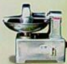
EC-506 切菜機 用途：切菜、切絲、切片、切丁、切絲、切片 雙層馬力 尺寸(mm) DC 170P 530x430x450 AC 110P 710x610x500