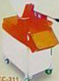
EC-311 平切切丁機 用途：切菜、切片、切絲、切片 切菜、切絲、切片、切丁 馬力 尺寸(mm) 110w 340P 600x400x400