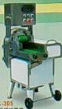
EC-305 雙層切菜機 用途：切菜、切絲、切片、切丁、高壓刀 馬力 雙層刀 尺寸(mm) 交流110Pw 110Pw 600x500x1200 110Pw 110Pw