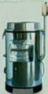
EC-509 / 510 球根切菜機 用途：切球、切絲、切片、切丁 雙層馬力 尺寸(mm) 重量 EC-509 110P 530x530x900 110kg EC-510 20P 750x750x1000 200kg