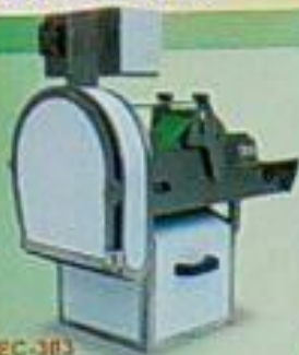
EC-303 雙層切菜機 用途：切菜、切絲、切片、切丁 高壓刀 馬力 尺寸(mm) 重量 110Pw 700x700x710 33kg DC