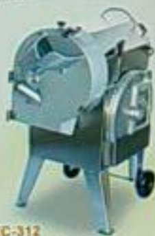
EC-312 球根切菜機 用途：切球、切絲、切丁、切片、切絲、切片、切丁 雙層馬力 尺寸(mm) 重量 EC-312 110P 750x750x900 70kg EC-311 110P 680x700x1000 300kg