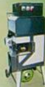
EC-618 玉米粉和機 用途：將玉米粉和成粉團 馬力 尺寸(mm) 重量 110P 450x500x1070 55kg