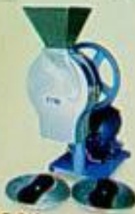
EC-619 紅薯切片機 用途：切片、紅薯片、切片 馬力 尺寸(mm) 重量 170P 480x280x390 25kg