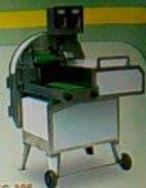
EC-306 特大型雙層切菜機 用途：切菜、切絲、切片、切丁 馬力 尺寸(mm) 重量 AC 1000x770x1400 130kg 110Pw